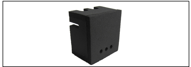
Fig. 2 Noise reduction AZURA Silencer

The noise reduction AZURA Silencer is only for reducing the noise emission.